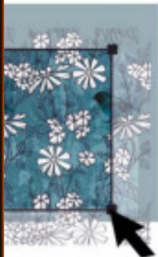
Illustration par Ori Toor et Vasjan Ketro. Pour en savoir plus, voir la fenêtre À propos.

© 1987-2018 Adobe. All rights reserved. Consultez la notice relative aux brevets et aux informations juridiques dans la boîte de dialogue À propos.